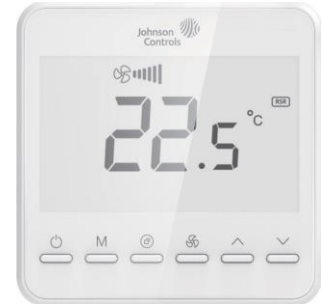
Tabla 1: características y beneficios

Los T7200 tienen una gran pantalla LCD con visores del estado de modo de trabajo (enfriamiento, calefacción, ventilación de aire, calefacción por piso radiante), velocidad del ventilador, temperatura interior, punto de operación, etc.